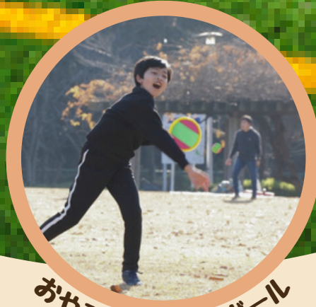
おわこでキャッチボール