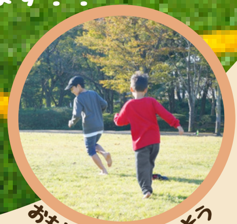
おもいっきりきょうそう